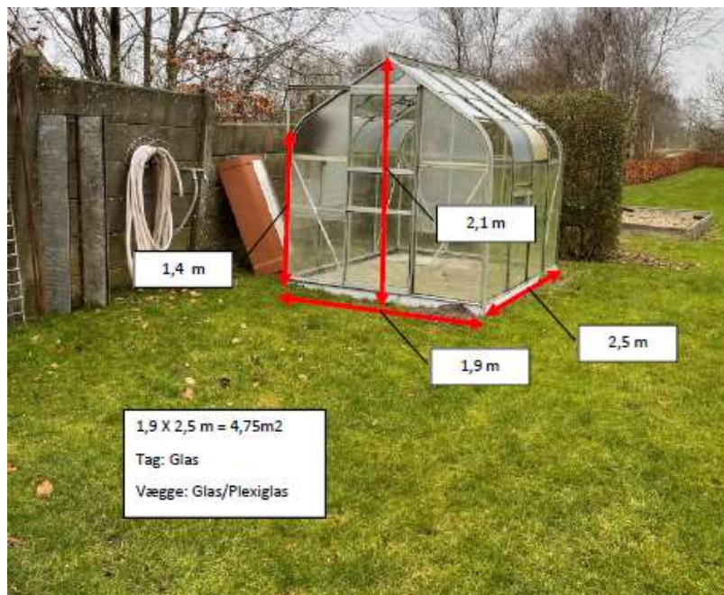
Målsat foto af ansøgte drivhus