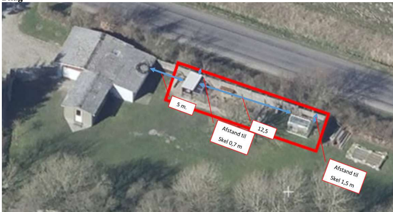
Luftfoto påtegnet afstand mellem bygninger og skel